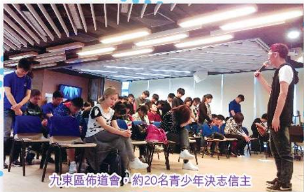
九東區佈道會，約20名青少年決志信主

「關祢咩事」佈道會於4月9日假Methodist City Space舉行，當日邀得Eternity音樂事工透過詩歌、遊戲、話劇及見證分享，激勵青少年隊員，讓他們重新思考、與上帝建立更美好的關係。