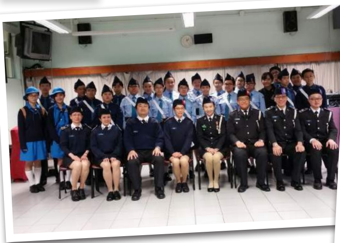
◀ 第 337 分隊立願禮，主辦單位：元朗公立中學