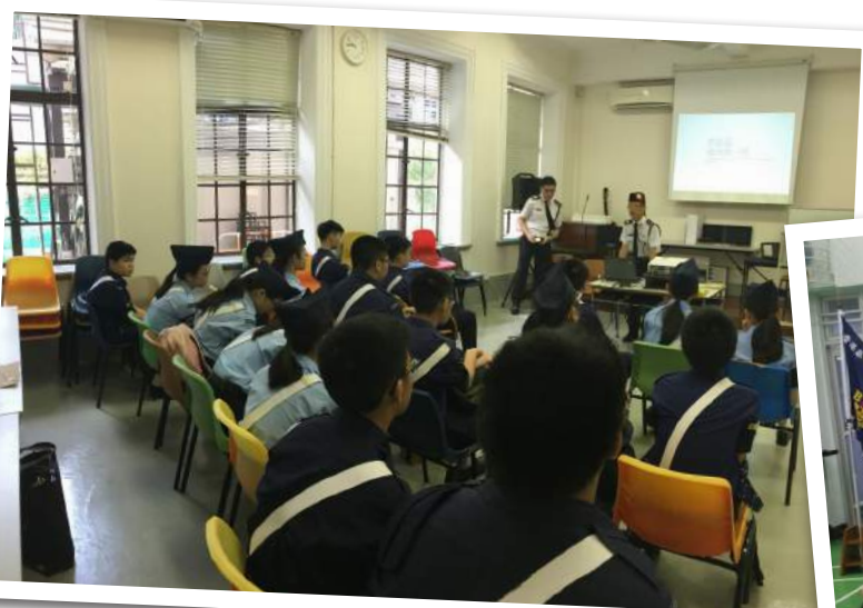
◀ 港島區通訊章一、二級課程 ▼ 第 341 分隊立願禮，主辦單位：聖公會聖士提反堂