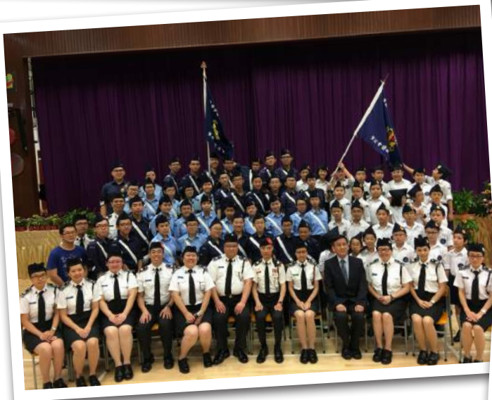
▶ 第 137 分隊及第 199 分隊聯合立願禮， 主辦單位：聖公會德田李兆強小學、聖公會聖道堂 ▶ 第 21 分隊立願禮及第 348 分隊成立禮， 主辦單位：基督教聖約教會堅樂堂、基督教聖約教會恩樂堂