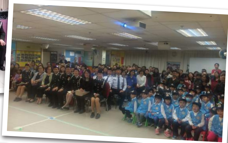
▼ 第 347 分隊成立禮，主辦單位：荃灣靈糧堂