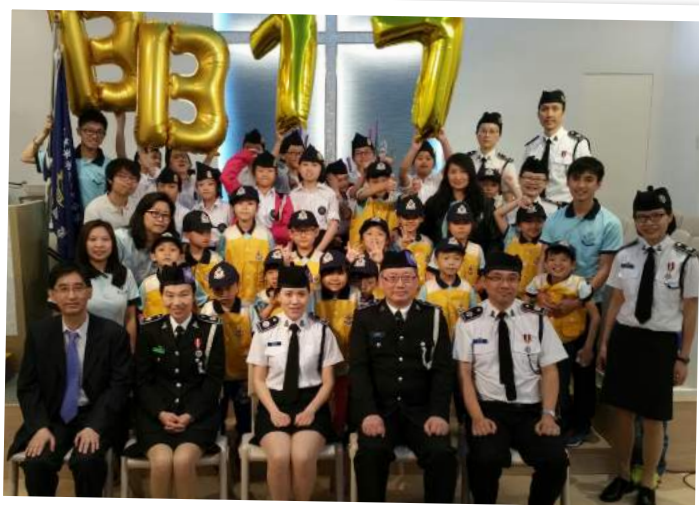
◀ 第 77 分隊立願禮，主辦單位：基督教樂道會深水埗堂 ▼ 第 252 分隊參與九中區大露營，主辦單位：神召會石硤尾堂