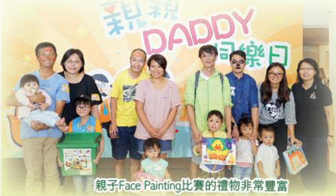
親子Face Painting比賽的禮物非常豐富

本會一直致力推動和諧家庭訊息、鞏固家庭正面價值，臻品中心於6月12日假愉景新城舉行親子活動「親親Daddy同樂日」，特設兒童室內繩網、品格教育職業體驗、繽紛波波池、親子手工體驗等活動；場內更安排本會小綿羊隊員於台上表演花式步操，並舉行親子Face Painting比賽，讓家庭同享親子樂，並強化父親在家庭中的角色，讓父親們渡過愉快難忘的父親節。