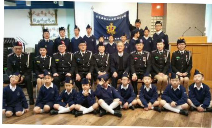
第 346 分隊成立禮，主辦單位：香港宣教會恩錫堂 ▶