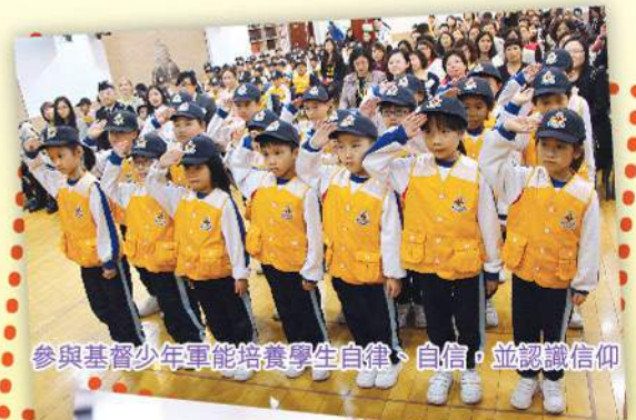
參與基督少年軍能培養學生自律、自信，並認識信仰

本著「一切為孩子，孩子為一切」的理念，路德會聖十架學校一切以孩子的發展為先，校長、教師與導師團隊攜手同工，一同用心栽種幼苗，期望學生們能像小樹苗一樣，茁壯成長。