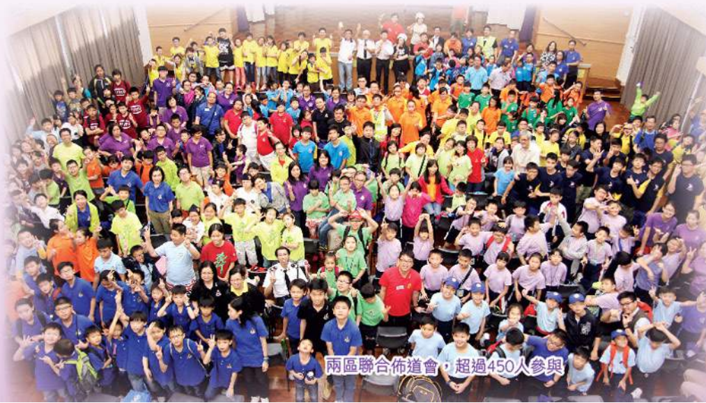
兩區聯合佈道會，超過450人參與

兩場佈道會合共約有520人參與，當中44名兒童及20名青少年決志，祝福他們在主裡有美好的成長！