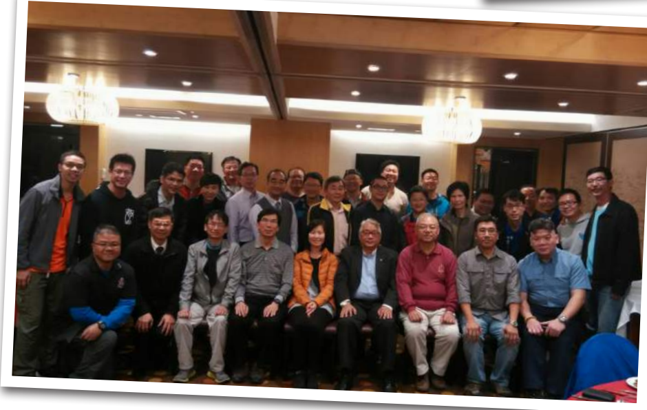
◀ 執行委員會及五區委員會於 3 月 7 日舉行新春飯局