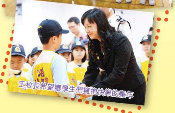
王校長希望讓學生們擁抱快樂的童年