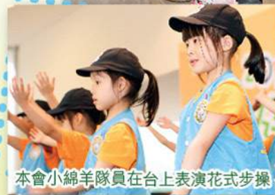
本會小綿羊隊員在台上表演花式步操