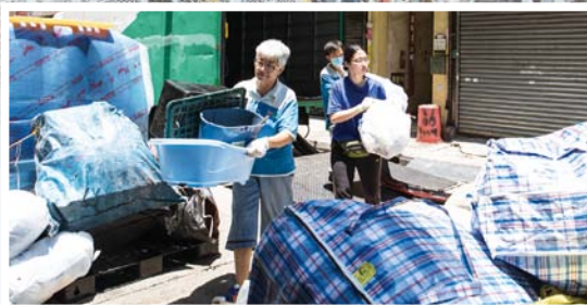
從街站或大廈收集得來的「雜膠」會先運到服務站分類及壓縮