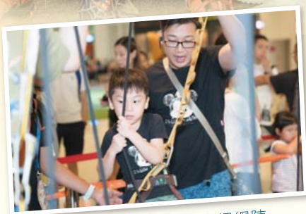
父子合力完成的深山繩網陣

兒童繩網是香港基督少年軍的專長，而親子們在這天都能體驗繩網的樂趣和刺激。一班專業的歷奇教練帶領小朋友挑戰繩網陣的四大關卡，包括：「泰山繩」、「時光隧道」、「交叉繩」及「彩虹橋」。過程中，父親與孩子一同經歷不同挑戰，跨過重重難關。