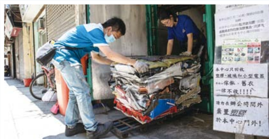
塑膠經反覆壓榨變成四四方方的貨物預備運至回收場