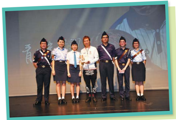
青年籌委在活動過程中獲益良多

青年對談2017於4月1日順利舉行，今年我們邀請了香港首席保齡球運動員、首位香港保齡球世界冠軍及2016年香港十大傑出青年得主胡兆康先生（康仔）蒞臨分享他在運動員生涯中的得與失，期望藉此鼓勵隊員積極面對人生的困難及挑戰。是次對談活動由青少年隊員負責統籌，除了對談分享，我們更預備了即場Wii遊戲模擬保齡球賽道，讓康仔於現場大顯身手，並邀請現場導師及隊員與康仔切磋球技，每一位參加者都非常享受這次難得的對談交流時間。