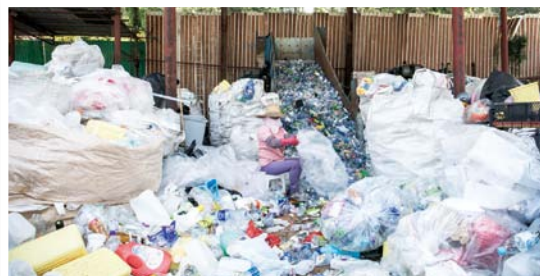
成千上萬的膠樽卻只是場內的冰山一角