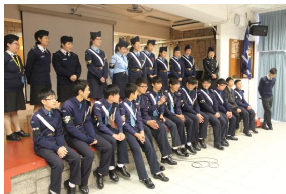
隊員逐一分享個人感受