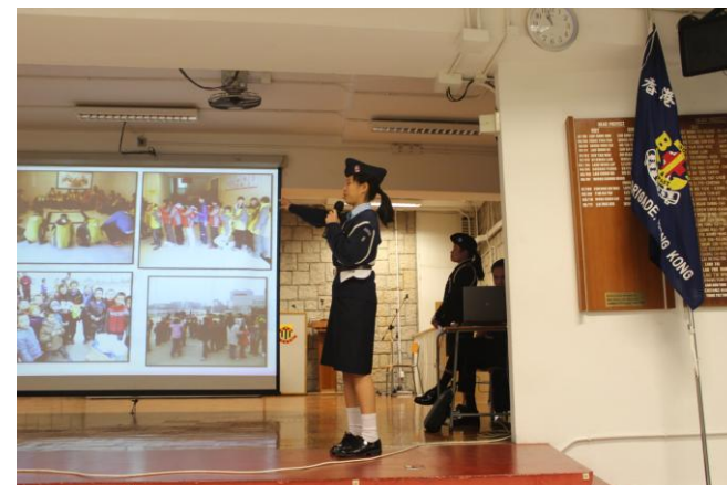
隊員在台上講述旅程經歷