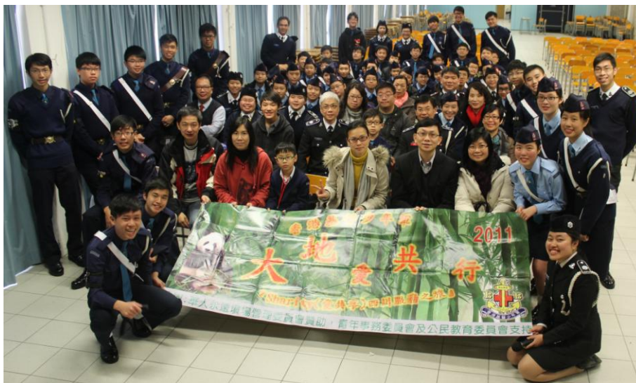
出席嘉賓、家長及隊員大合照