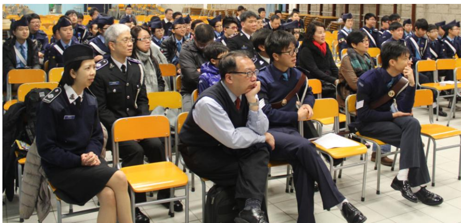
台下嘉賓、家長及隊員留心聆聽分享